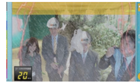
●豪雨・暴風擬似体験ヘラセオン