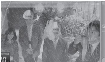
豪雨・暴風擬似体験学習アトラクション