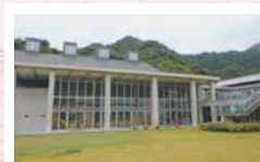
呉市豊町大長5915番地3