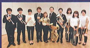
広島文化学園大学 学芸学部 音楽学科