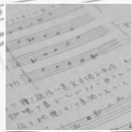
▲[学習ノート] 音楽学校時代