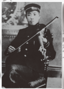
▲[写真] 福山中学時代

呉市焼山中央2丁目8番12号 昭和市民センター 2階 お問合せ 電話 0823-34-1200 受付時間 9:00-17:00(休館日除く) ※休館日は、毎月29日と、その他年2回の害虫駆除などがありますが、不定期な部分がありますので、ご了承ください。