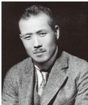
ふじい きよみ 藤井 清水 (1889~1944)

2018年10月7日(日) 呉市文化ホール 13:00開演(12:30開場) 呉市中央3丁目10番1号