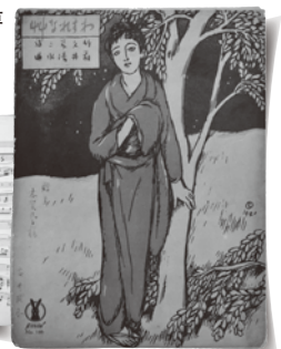
▶[楽譜] わすれな草 作詩：竹久夢二 作曲：藤井清水 装丁：竹久夢二