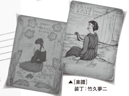
▲[楽譜] 装丁：竹久夢二