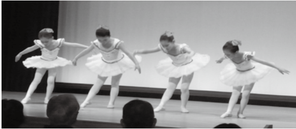
春の文化祭(バレエ)

吉浦では、文化団体連絡協議会(吉浦文連)に加入している団体や、まちづくりセンターで実施している講座やサークル活動などを発表する場として、春と秋に文化祭が開催されています。春の文化祭では、太極拳、コーラス、バレエ、大正琴、銭太鼓、カラオケなどを披露するステージ発表を、秋の文化祭では、書道、華道、水墨画、絵手紙、盆栽などの作品の展示が行われています。そのほか、布あそびの体験コーナーや個人での参加もあり、工夫された発表内容となっています。また、女性会の協力により、バザー(食堂)も開かれるなど、文化祭は、住民が吉浦地区の文化を通して、いきいきと活動する交流の場となっています。平成29年度の春の文化祭は、平成30年3月3日(土)と4日(日)に開催される予定です。