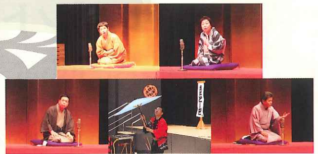
くれまちかど寄席in音戸 2015年10月25日公演風景

いつでも面白く楽しい気分で過ごすことができます。 ありがとうございます。(70代 男性)