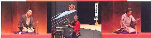
くれまちかど寄席in音戸 2015年10月25日公演風景