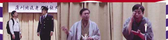
公演風景(くれまちかど寄席 in 蒲刈 2015年2月20日 蒲刈まちづくりセンター)