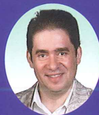
レオニド・ボムステイン Леонид Бомштейн