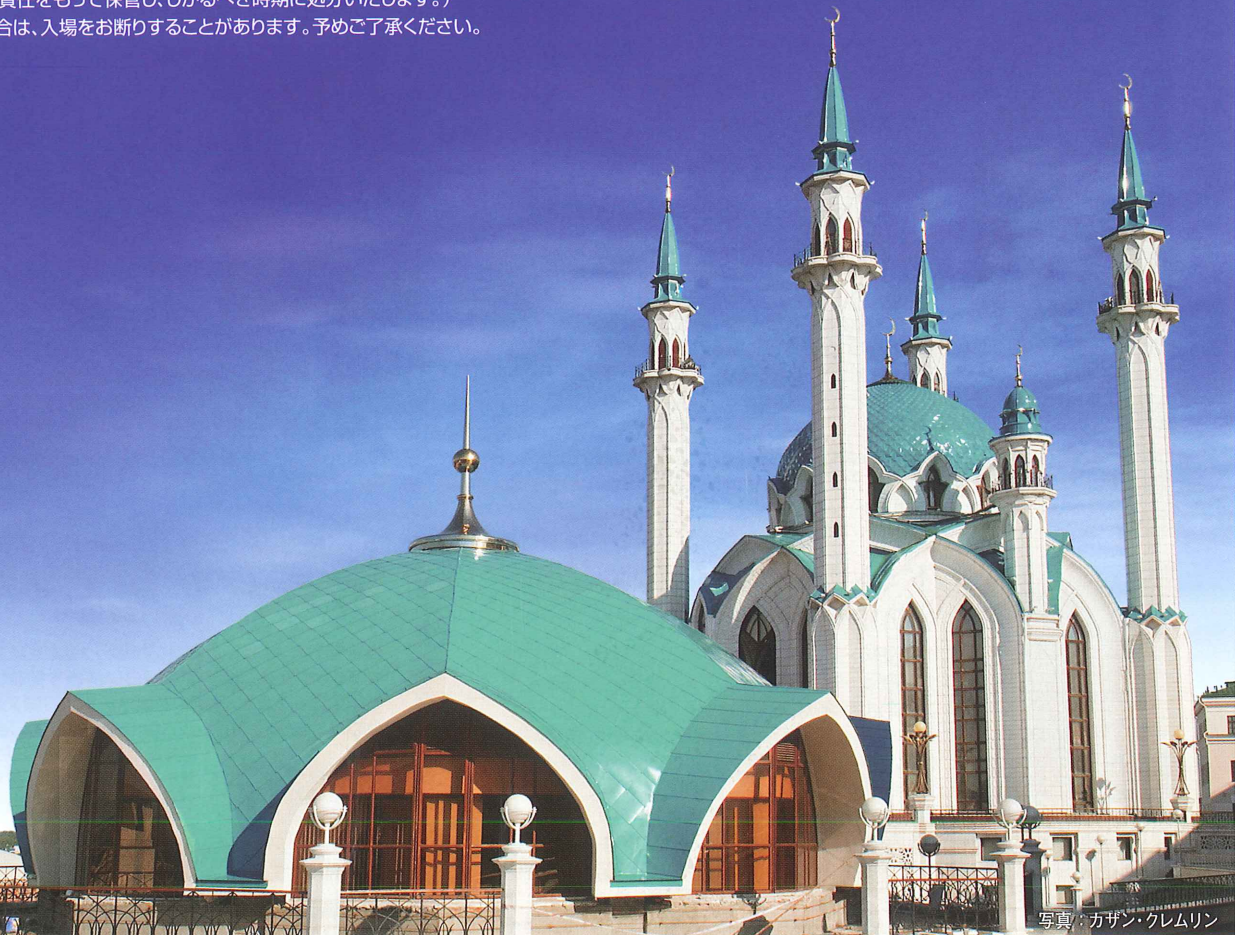
写真: カザン・クレムリン

■主催: 公益社団法人 国際音楽交流協会 ( http://www.imea.or.jp/ ) 本願寺 井村屋グループ株式会社 ダイキン工業株式会社 大阪ガス株式会社 敷近設備工業株式会社 株式会社大原の里