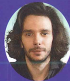
エミル・リヒナー Эмиль Лихнер