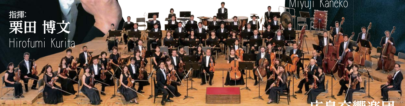
管弦楽： 広島交響楽団

2017 1.15 開演／14:30 開場／14:00 呉市文化ホール 呉市中央3丁目10-1 http://kure-bunka.jp/